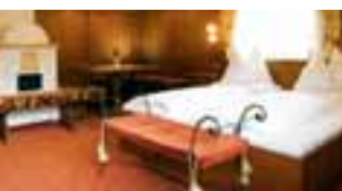
Suite Bergkristall (ca. 35 m 2 )

NEU: Tiefgarage 10 Euro/Tag (200m entfernt)