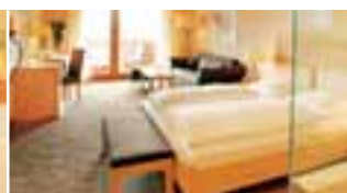
Kuschelsuite (ca. 40 m 2 )

Hier sind Gefühle willkommen: Eine freistehende Designer-Duo-Badewanne mitten in der luxuriös gestalteten Suite macht genauso Lust auf Entspannung wie die große Regendusche mit Farblichttherapie. Dabei darf aber der herrliche Ausblick auf die Riesenernergruppe nicht zu kurz kommen!