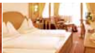
Juniorsuite (ca. 30 m 2 )

Südtirol ist das Land der Burgen, Schlösser und Ansitze. Dort war immer ein Platz der begehrteste: das Zimmer im Turm! Von hier aus genießt man herrliche Ausblicke auf die umliegende Bergwelt, sieht oder schaut einfach nach, wie schön das Wetter heute wird. Das alles mit viel Platz drumherum und einer gemütlichen Sitzcke im Erker.