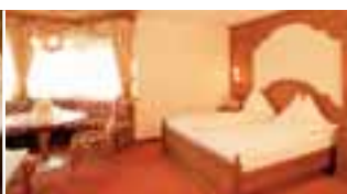
Turmsuite (ca. 35 m 2 )