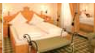
Doppelzimmer De Luxe (ca. 24 m 2 )

Wer sagt denn, dass 4-Sterne-Komfort etwas mit Größe zu tun hat? Je kleiner, desto feiner: Auch auf runden, geräumigen 30 Quadratmetern lässt es sich, versehen mit einem optisch abgeteilten Wohnraum, richtig gut leben. Alles ist aus wunderschönem Fichtenholz und höchst gemütlich eingerichtet.